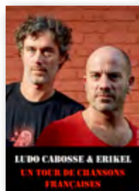
SPECTACLE MUSICAL Sam 25 nov 21h15