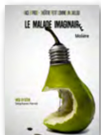
Mer 4, 11, 18, 25 oct 20h30