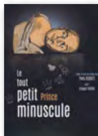
SEUL-EN-SCÈNE Mar 20 fév 20h30