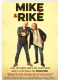
SPECTACLE MUSICAL Mer 27 sept 20h30