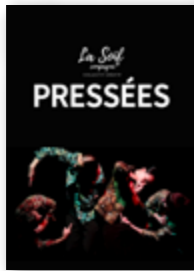
DANSE Mar 24 oct 20h30