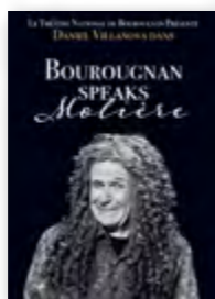
Mer 8, 15, 22, 29 nov 20h30